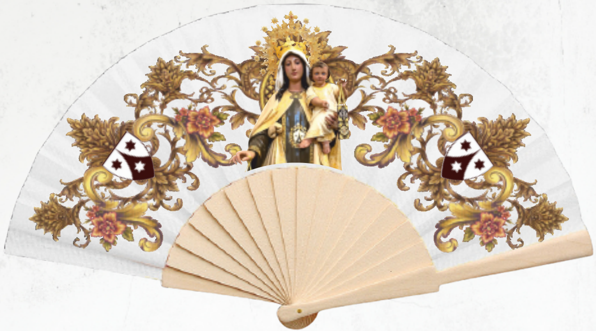
V-3688 Abanico de varillas de madera natural y tela en poliéster