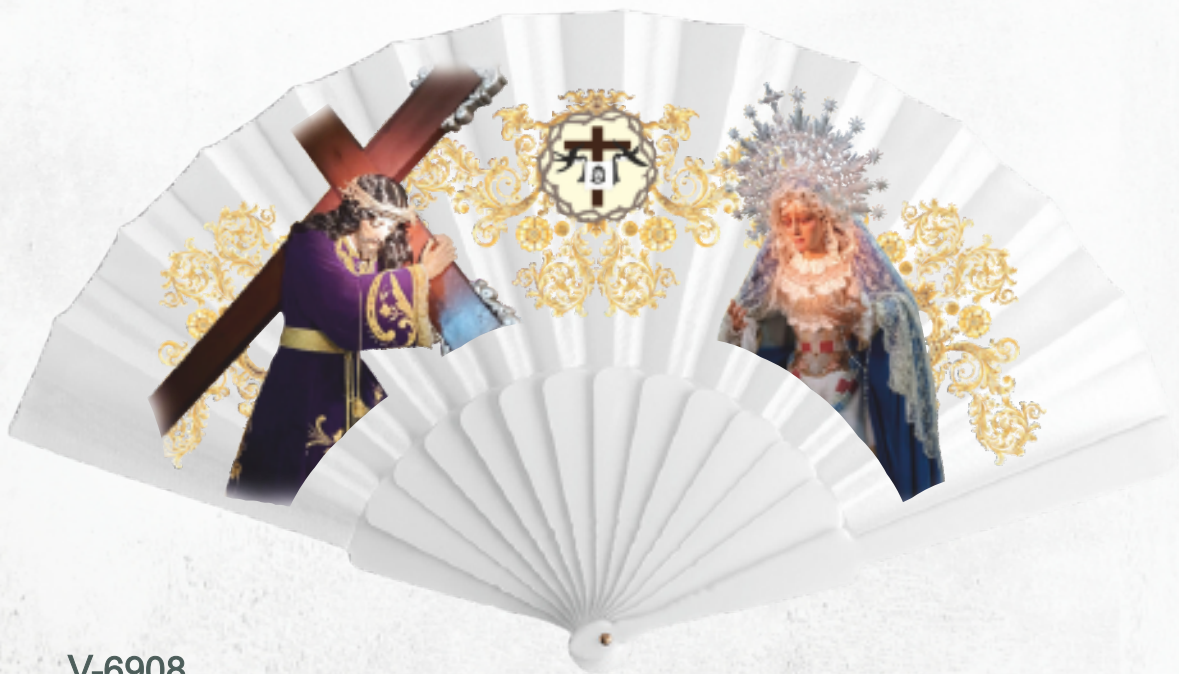
V-6908 Abanico de varillas de plástico y tela en poliéster